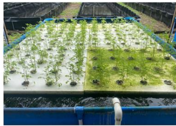
Sistema de cultivo acuapónico e hidropónico. Tomate, melón, cilantro, albahaca y tomillo, entre otros, crecen en un sistema cerrado de cultivo diseñado para la región del Urabá antioqueño, pero adaptable a diversos entornos geográficos. Se trata de un sistema sostenible, conocido como acuaponía, adecuado para hacer frente a los avatares del cambio climático y, además, se plantea como un espacio interdisciplinario de empoderamiento de mujeres y familias de la región.

En la sede de Estudios Ecológicos y Agroambientales de la Universidad de Antioquia – Tulenapa –, en Urabá, se desarrolla un proyecto basado en la acuaponía como práctica que permite la producción sostenible de alimentos y el empoderamiento comunitario.