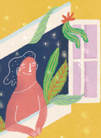
ILUSTRACIÓN: TATIANA CASTRILLÓN @TATOILUSTRADORA