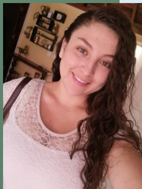
TEATRO Camila Rincón