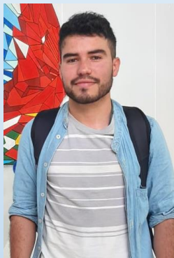
PINTURA Camilo Marín