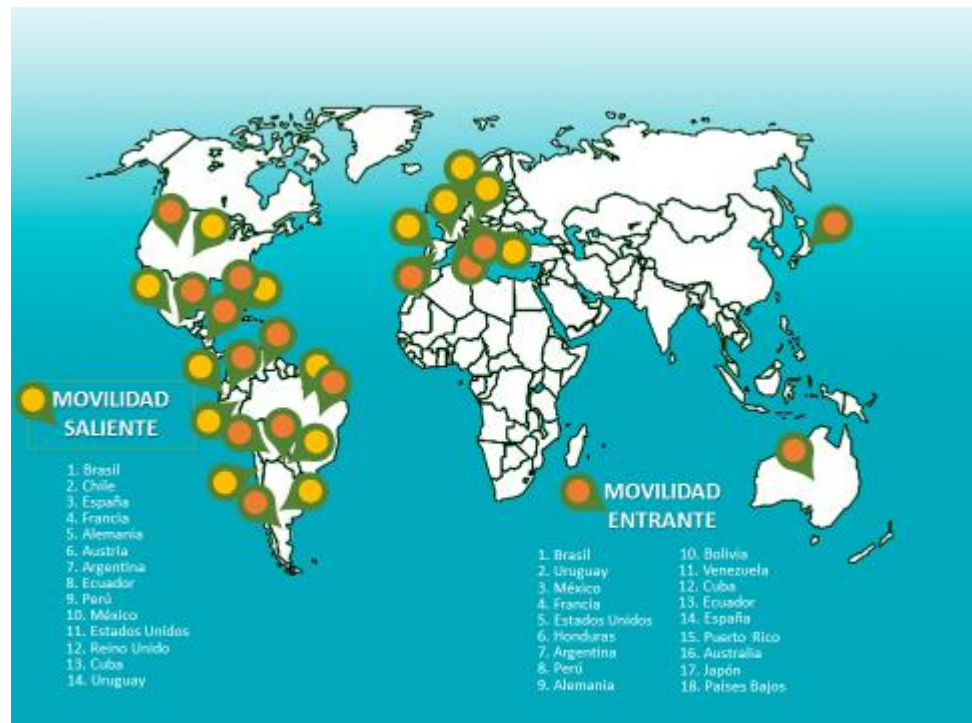
Ilustración: Relación movilidad en doble vía 2011 a 2017-1.