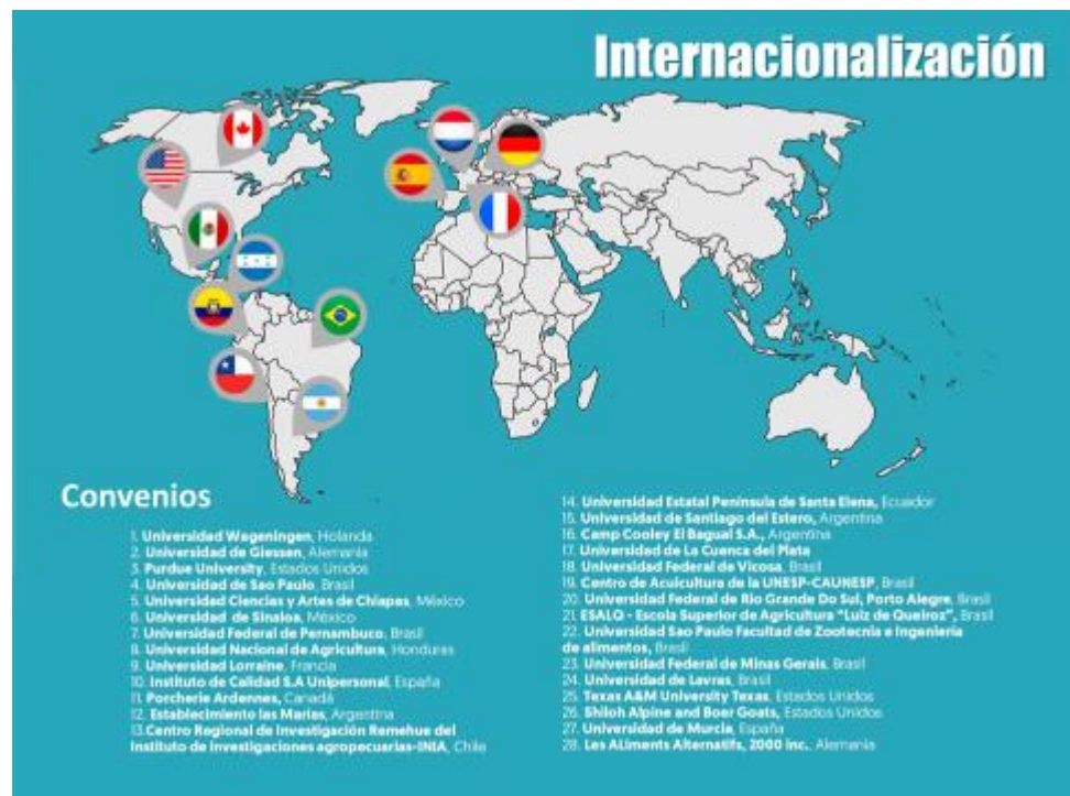
Ilustración: relación de convenios vigentes con IES del mundo.