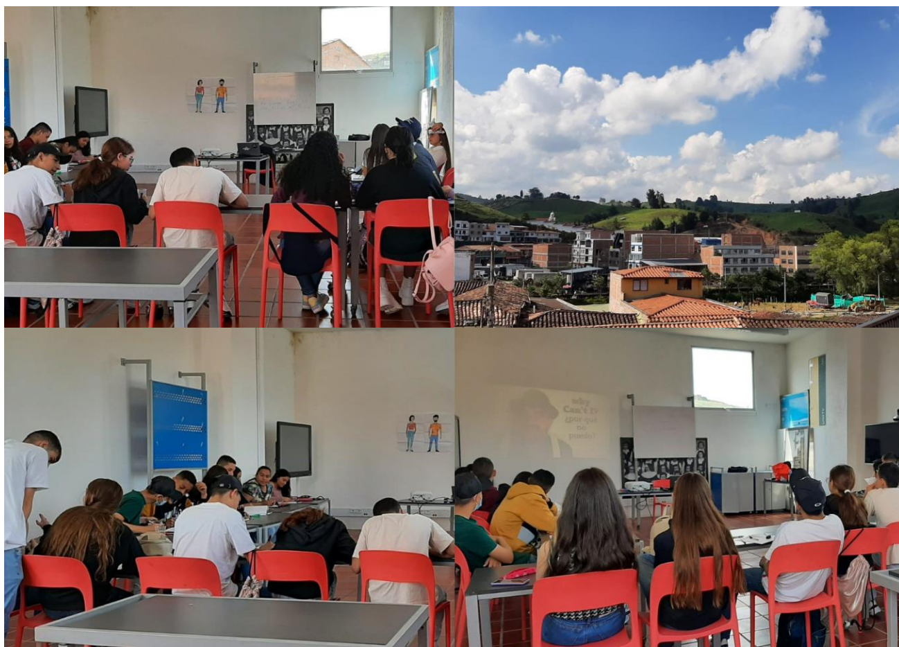
Estudiantes en el aula de inglés del Parque Educativo del municipio

Atendiendo las necesidades del contexto territorial donde será impartido el semillero, se busca contribuir con el proceso de formación integral de los estudiantes en aspectos que puedan apoyar su vida académica con una oferta de contenidos coherentes con sus necesidades y expectativas en cuanto al uso del inglés. Por este motivo, se proponen temas dentro del plan de estudios relacionados con aspectos de la vida personal, familiar y del entorno territorial de los participantes, buscando así fortalecer las competencias básicas necesarias para presentar las pruebas Saber 11 en inglés y promover una actitud reflexiva frente a los textos, la lengua, la cultura propia y la foránea.