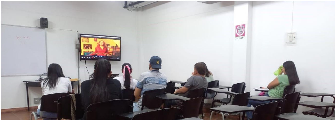
Estudiantes del curso de adultos en Santa Fe de Antioquia

Puede encontrar información adicional de inicio de clases, horarios y grupos en el siguiente enlace de inscripción o a través de regionesyvirtualidadidiomas@udea.edu.co .