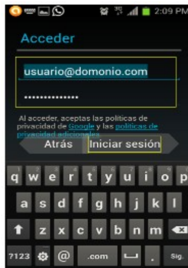
Figura 5. Formulario para digitar usuario y contraseña