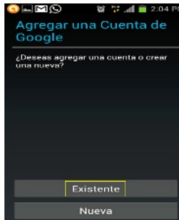
Figura 4. Pantalla para agregar cuenta existe institucional