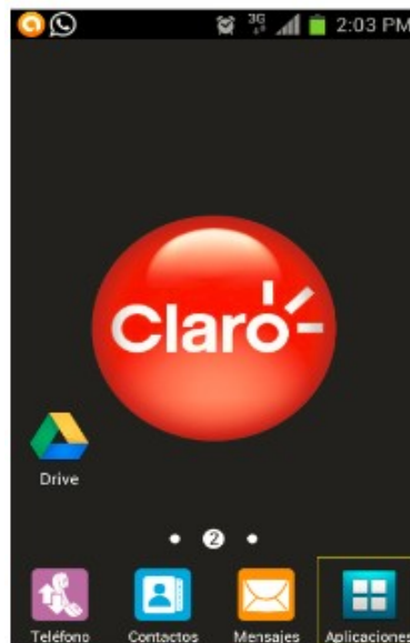
Figura 1. Pantalla inicio al menú principal