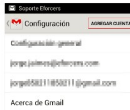
Figura 3. Pantalla para agregar cuentas en el aplicativo Gmail

3. Con la aplicación “Gmail” en ejecución, ingresar a “AGREGAR CUENTA”