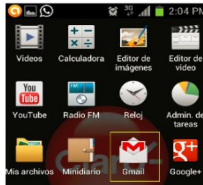
Figura 2. Lista de aplicativos instalados en el dispositivo

2. En la lista de aplicaciones, buscar y seleccionar “Gmail”