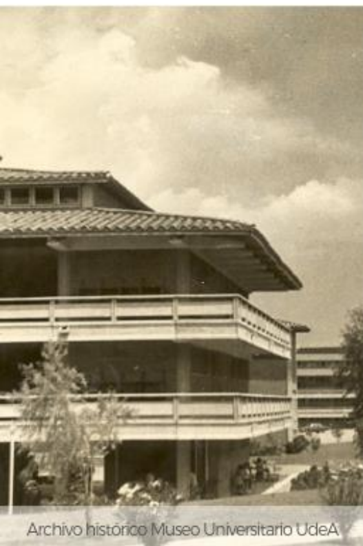
Archivo historico Museo Universitario UdeA