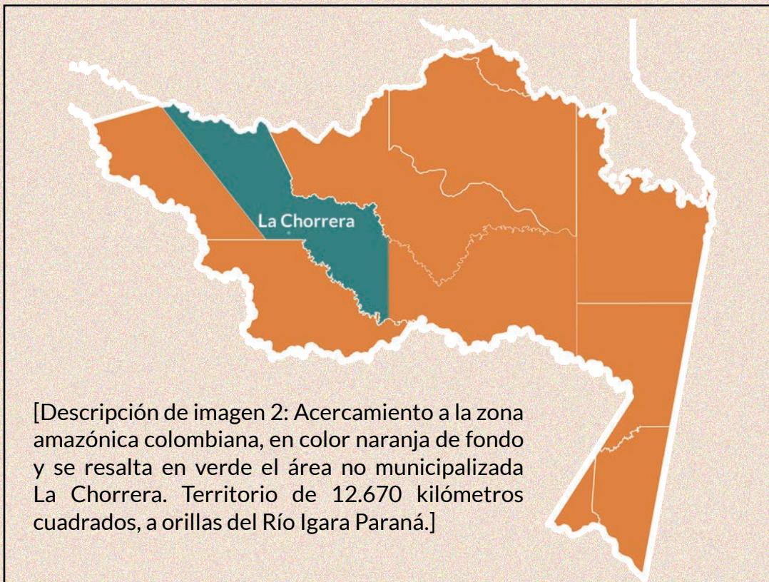
[Descripción de imagen 2: Acercamiento a la zona amazónica colombiana, en color naranja de fondo y se resalta en verde el área no municipalizada La Chorrera. Territorio de 12.670 kilómetros cuadrados, a orillas del Río Igara Paraná.]