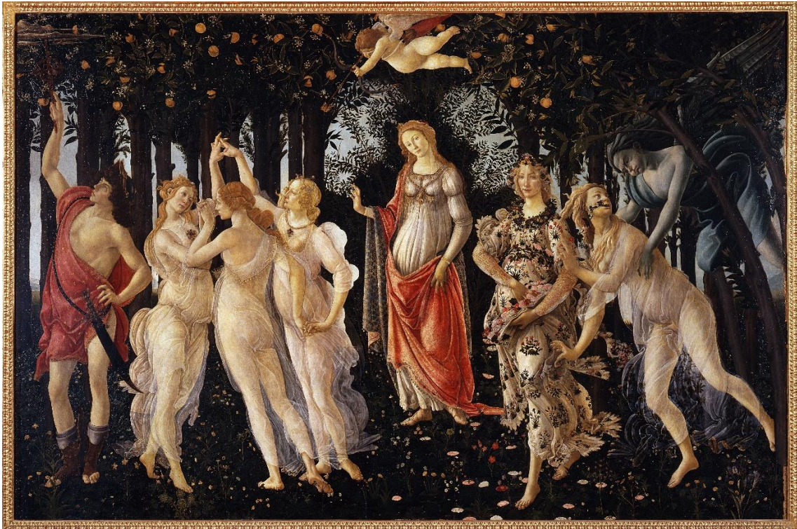
La alegoría de la Primavera. (1480). Témpera sobre madera. 203 x 314 cm. Galería Uffizi. Florencia.

romántico a la vida a través de la idealización de la feminidad de la que él tanto contempló y anheló. Nacido en 1445 en Florencia, Botticelli emprende su camino por la pintura impulsado por los Médicis y por su maravilloso talento para disponer de una pincelada delicada, fina y precisa mediada por las maravillosas representaciones que crea en su imaginación envolviéndonos en una atmosfera de ensueño. La Fortaleza (1470) recrea la estilización con la que el artista representaría el cuerpo femenino llegando a constituir un estilo propio. El color y sus composiciones nos introduce a un estado de fiesta que nos hace salirnos de sí para encontrarnos de nuevo. Un encuentro que en el hoy se ve truncado por distanciamiento que permite la celebración, pero no la comunión.