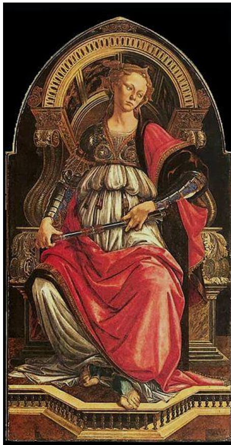
La Fortaleza. (1470). Temple sobre madera. 167 x 87 cm. Galería Uffizi, Florencia.