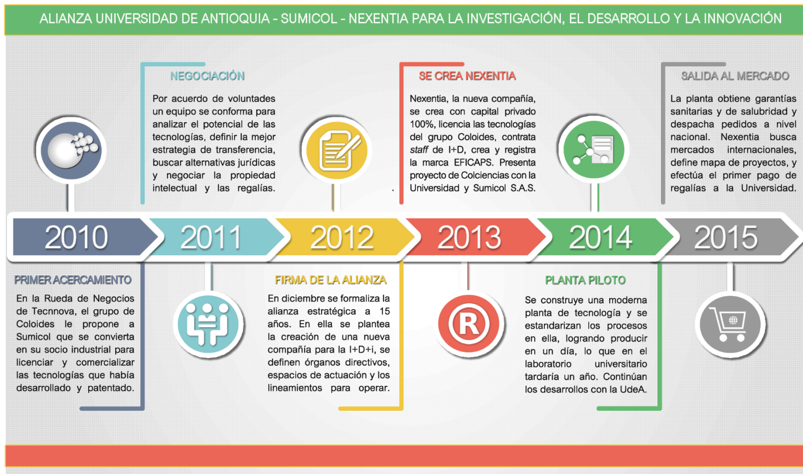
Figura 2. Línea de tiempo alianza Sumicol - UdeA